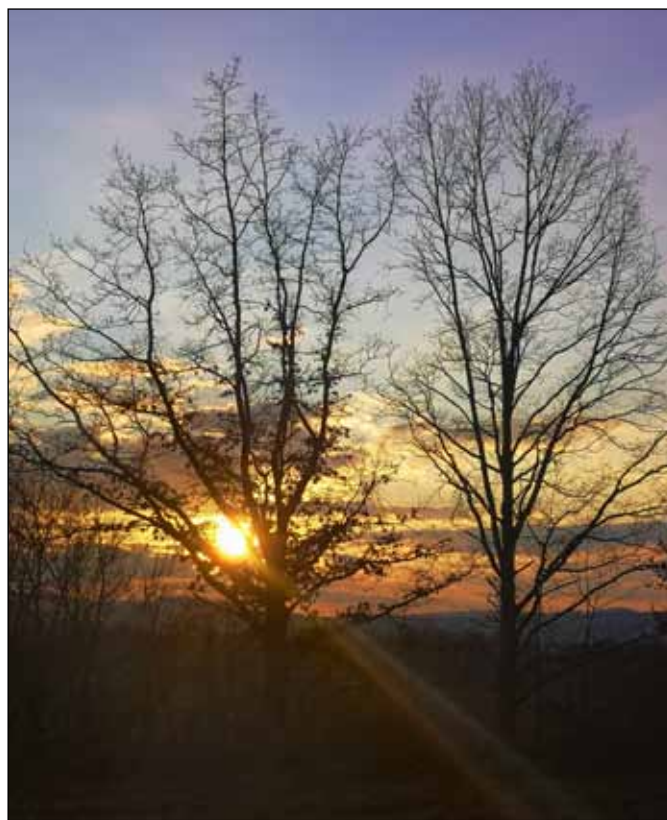
Okolí Lesnice na jaře 2020

Do pískoviště byly dány hračky pro děti, které si přijdou na pískoviště hrát. Prosíme, nerozebírejte si domů tyto hračky, slouží všem a děti si potom nebudou mít s čím hrát.