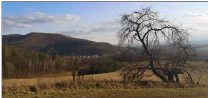
Okolí Lesnice na jaře 2020