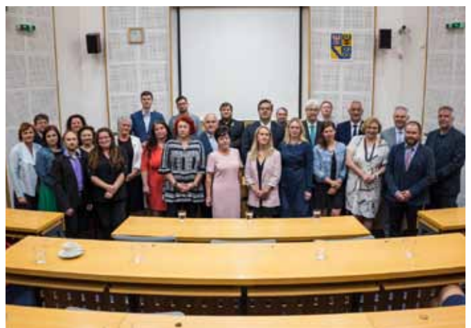
Prezentace a vyhodnocení soutěže Vesnice roku